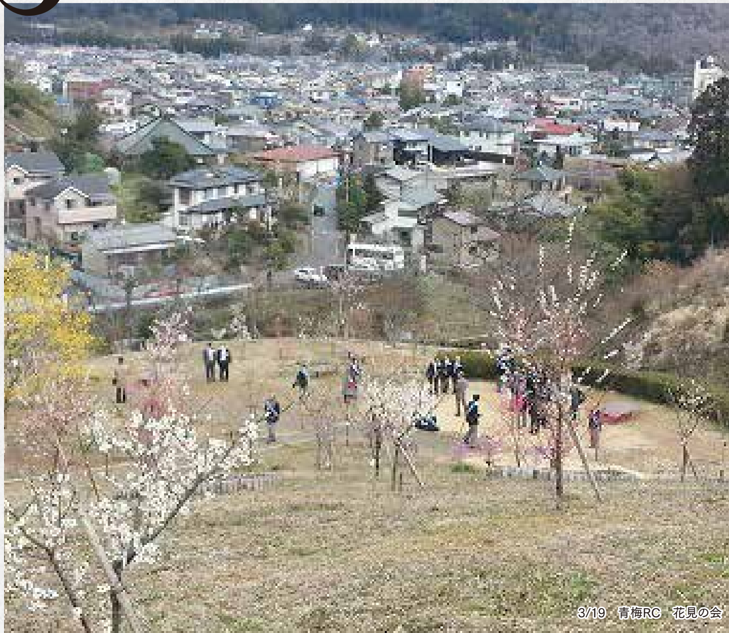
3/19 青梅RC 花見の会